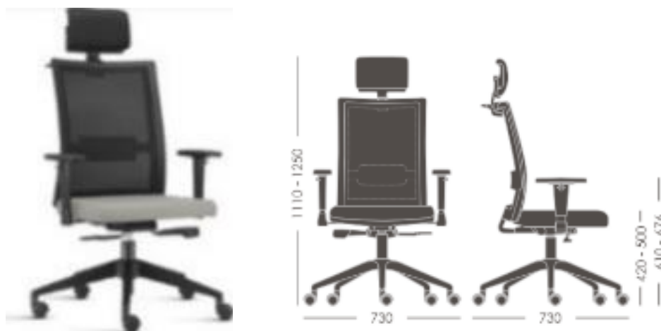
Imagem meramente ilustrativa, válida como referência

acúmulos de partículas estranhas ao produto, além de oferecer acabamento e proteção ao usuário contra as partes móveis internas do equipamento. Apoia braço com ajuste angular horizontal em, no mínimo, 03 posições distintas. Possui apoia braço em poliuretano integral skin sendo suas dimensões de 80 a 90 mm de largura nas extremidades e 250 a 260 mm de comprimento. Os elementos em aço carbono do braço que por ventura ficarem aparentes recebem acabamento por meio pintura eletrostática de cor preta.