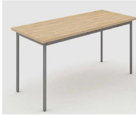
Imagem meramente ilustrativa, válida como referência

1.4. Para o item 5 do Lote 1, o descritivo técnico é o seguinte: