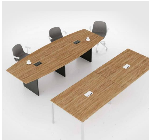
Imagem meramente ilustrativa, válida como referência

1.7. Para o item 8 do Lote 1, o descritivo técnico é o seguinte: