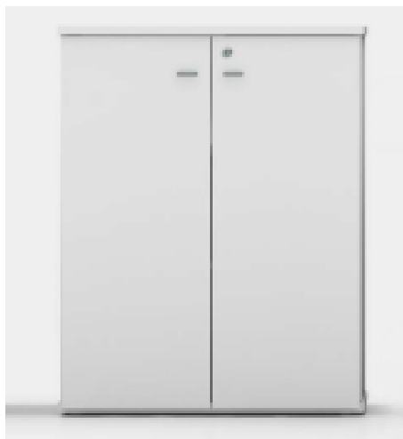
Imagem meramente ilustrativa, válida como referência

3.4. Para os itens 4 e 5 do Lote 3, o descritivo técnico é o seguinte: