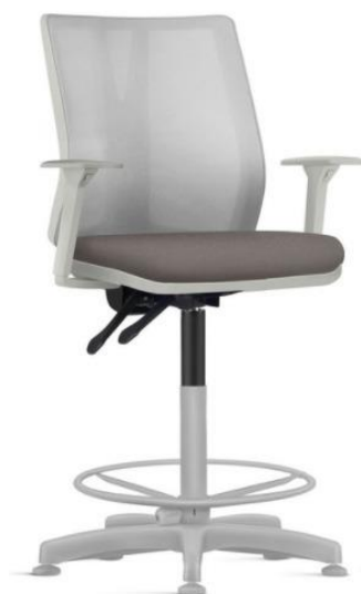
Imagem meramente ilustrativa, válida como referência