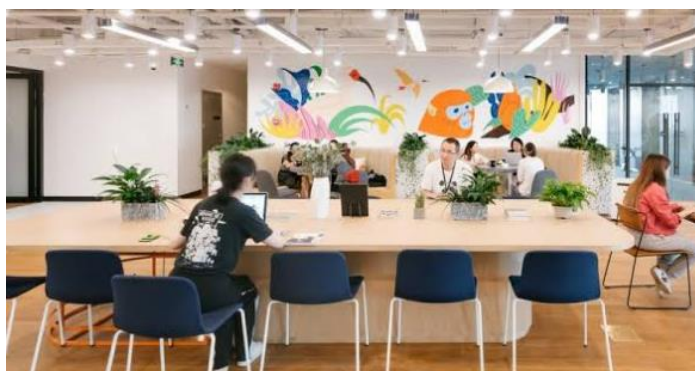
Imagem meramente ilustrativa, válida como referência

para suporte de fiação, tipo leito, para cabos de eletrificação, logica e telefonia, confeccionada em chapa de aço SAE 1020 com no mínimo 0,9mm de espessura, estrutura longitudinalmente através de dobras, furação para passagem de cabos, possui tratamento anticorrosivo por fosfatização e acabamento em pintura epóxi, sistema de fixação através de alças encaixadas as longarinas, orifício lateral de fácil remoção para passagem de cabeamento através das plataformas. Pé lateral, tipo trave, cor branco fosco, 02 peças, estrutura com travessa vertical de secção quadrada em aço tubular SAE de no mínimo 1020 de 50 x 50 x 1,5mm, travessa horizontal na secção quadrada em aço tubular SAE 1020 de no mínimo 50 x 50 x 1,5mm, sapata de nivelamento do piso com rosca 3/8 e corpo injetado em polipropileno