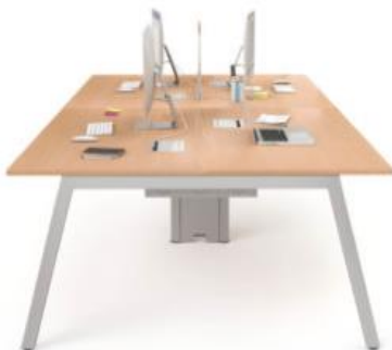
Imagem meramente ilustrativa, válida como referência

1.2. Para o item 3 do Lote 1, o descritivo técnico é o seguinte: