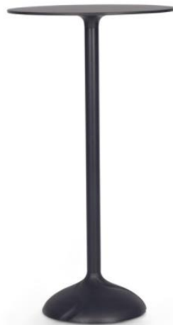
Imagem meramente ilustrativa, válida como referência

1.4.1. Mesa alta do tipo bistrô, com tampo redondo medindo no mínimo 600 mm, cor preta, produzido em resina de engenharia ou similar, alta durabilidade, base de sustentação produzida em aço maciço ou similar, fixados a uma coluna de sustentação com altura de no mínimo 110 cm, com pintura feita por tinta epóxi microtexturizada ou similar na cor preto fosco.