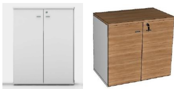
Imagem meramente ilustrativa, válida como referência

3.5. Para o item 6 do lote 3, o descritivo técnico é o seguinte: