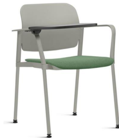
Imagem meramente ilustrativa, válida como referência

2.4. Para o item 6 do Lote 2, o descritivo técnico é o seguinte: