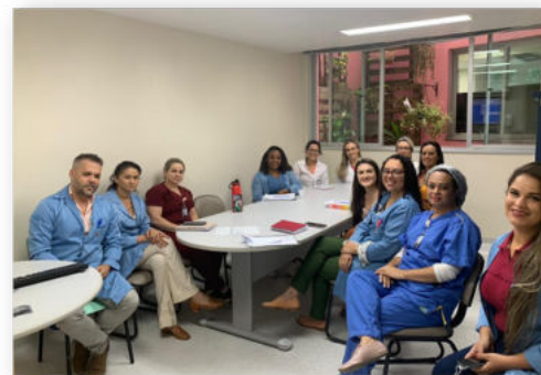
Reunião ordinária da Comissão Intra-Hospitalar de Doação de Órgãos e Tecidos para Transplante – CIHDOTT - 15/12/22

O Hospital Estadual Central – Dr. Benício Tavares Pereira (HEC) realizou, no dia 1º de dezembro, uma captação múltipla de órgãos. Um presente antecipado de Natal para cinco pessoas que terão suas vidas transformadas graças à decisão dos familiares que disseram sim para a doação de órgãos e tecidos. Foram captados dois rins, fígado e duas córneas.