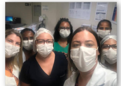
Ação do SCIH com enfermeiros e técnicos

Uma enfermaria foi escolhida de forma experimental para receber as primeiras intervenções e, gradativamente, toda a unidade de internação será contemplada.